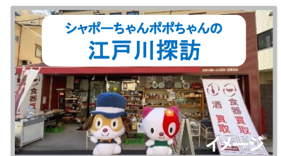
動画でご紹介したお店も登場予定です

地域のお店がシャポーで出張イベントを行います。YouTubeでもご紹介した商店街のお店などが登場予定で、各店にちなんだワークショップなどを企画中です。シャポーと地域をつなぎ、小岩をもっと知りたくなる、そんなイベントを目指していきます。