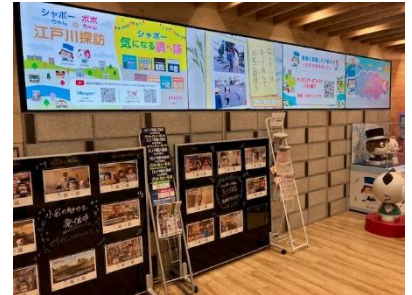
館内「まちかど広場」でも動画を放映中です

そして今春より、小岩で活躍するクリエイターや商店の方々とコラボレーションしたイベントを実施していきます。小岩で暮らす方も、小岩に初めて来た方も「思わず小岩を散策してみたくなる」「小岩がもっと好きになる」そんな取り組みを目指していきます。