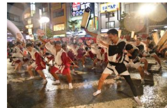
④高円寺びっくり連