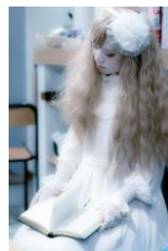
②自動人形オリンピア

アンティークショップのショーウィンドウから抜け出した、機械仕掛けのお人形。 硝子の瞳をそっと覗き込めば、ほら。そっとぜんまいが動き出します。