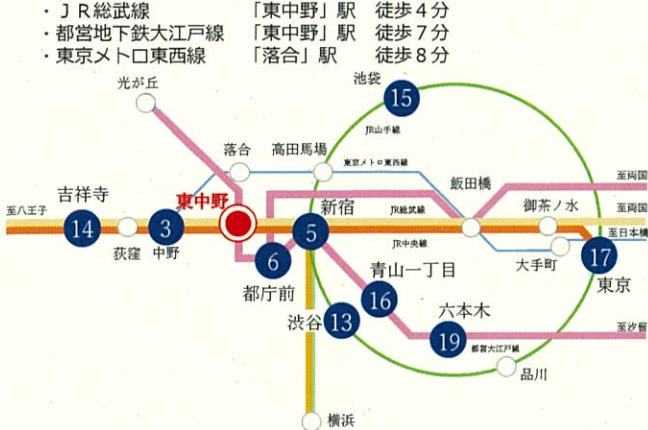
▲東中野駅から首都圏の主要駅までの交通アクセス図 ※3