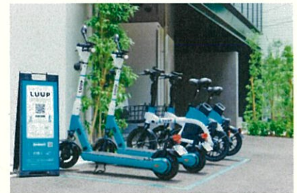
※LUUPポート イメージ写真。