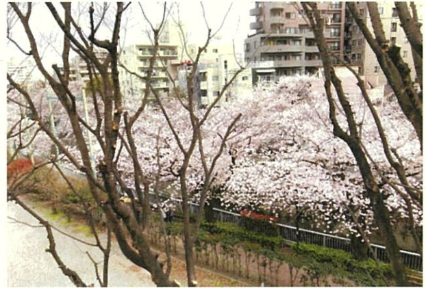
▲東側景観（本物件4Fバルコニーより、2022年撮影）