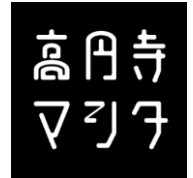
▲施設名称ロゴマーク

旧高円寺ストリート2番街は、高円寺の良さを大切にしながら、南北の通り抜けによる街の回遊の促進、オープンテラスの設置などを実施し、「新しい高円寺らしさ」をコンセプトに生まれ変わります。