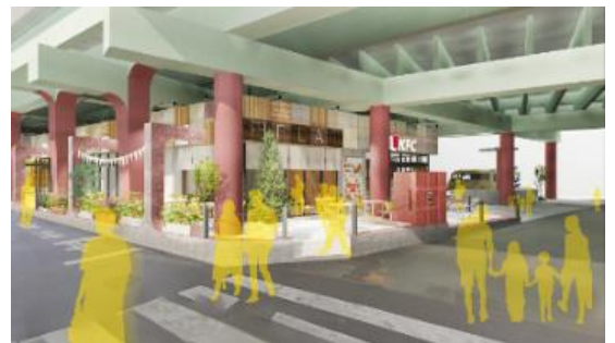
▲「高円寺マシタ」イメージパース

落ち着いたある半屋外テラス空間で全体に統一感を持たせつつ、これに組み合わされるショップがそれぞれの個性を演出します。そして高架橋は、錆止め色塗装を基調とすることで、鉄道高架の重量感や歴史性を強調します。この2つが、新しく高架の“マシタ”に生まれる活気やワクワク感を創り出していきます。