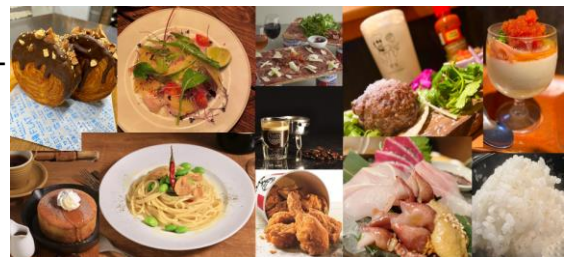
▲ご提供料理イメージ

「ミュージシャン」「芸人」発掘の場を設けた「390 RESTAURANT」や、「アートと地域情報の発信基地」というコンセプトの「タリーズコーヒーコミュニティ」などの高円寺文化を発信するショップが誕生。また、お米にこだわった食事の「米のこじま」、この一杯のために最高の肴をご提供する「この一杯のために」、店舗で焼き上げるパンやケーキとカジュアルフレンチ「パンとビストロ 高円寺FLAT」など、こだわりぬいたショップ7店がオープンいたします。