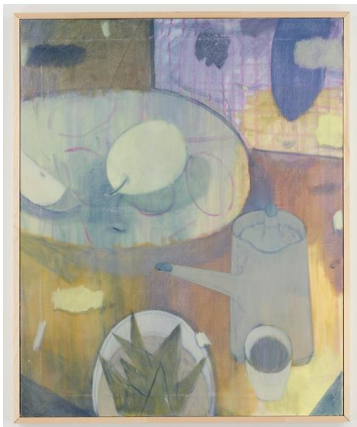
村松佑樹《梨とお茶》