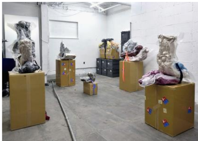
鈴木操 Untitled (Non-homogeneous arrangement) © Sou Suzuki