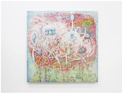
鈴木由衣《つぼのなる木たわたわ》