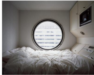
ミナミ・ノリタカ《B1004》(1972)より © Noritaka Minami, courtesy of KANA KAWANISHI GALLERY