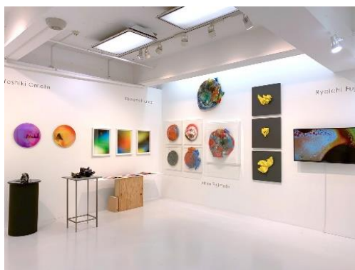
実施イメージ(過去のアートフェア出展の様様)