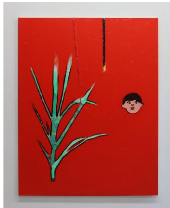
野島良太《My House》 ※参考作品 © Ryota Nojima, courtesy of HAGIWARA PROJECTS