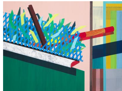
大八木夏生《格子模様と棒棒ポー》