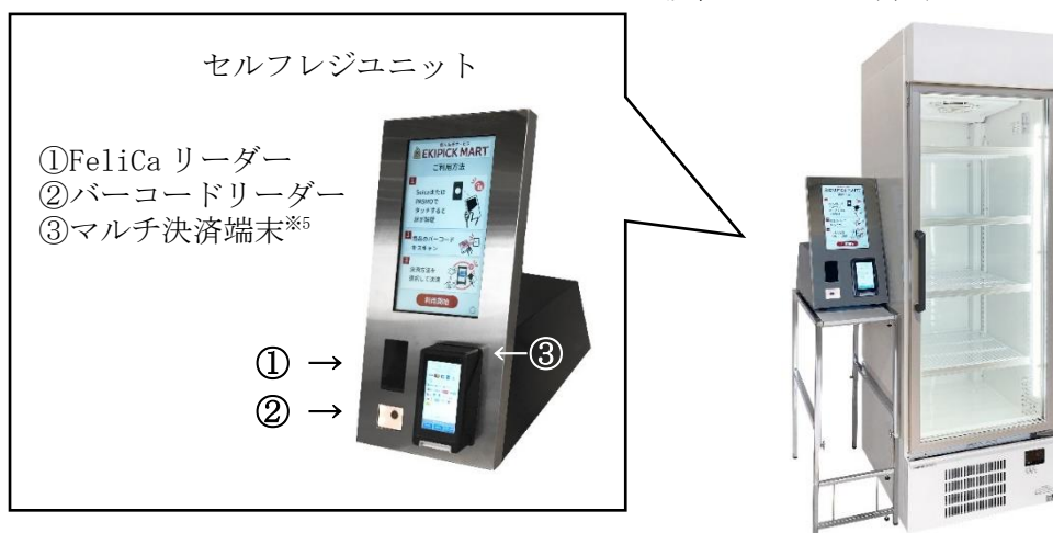
設置イメージ（冷蔵 1 ドアタイプ）

セルフレジの Felica **3 リーダーに交通系電子マネーのカード等 *1 をかざし、有効性が確認されると、ロックされている扉が解錠します。商品を手にとった後、扉を閉めると商品が購入できる機構となっており、扉の閉め忘れを防止します。また、電子マネー、クレジットカード、QR コード **4 などのキャッシュレス決済の利用が可能です。さらに、販売する商品特性に合わせて、販売時間の遠隔管理が可能で、設定した販売時間以外の時間帯は解錠できない仕様です。今回の実証実験では「冷蔵 1 ドア」「冷蔵 2 ドア」「冷凍 1 ドア」の 3 種類のショーケースを使用します。