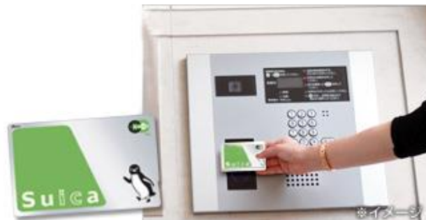
Suica 他交通系 IC カード入退室管理システムイメージ

※3 セントリックスは、東日本旅客鉄道株式会社、JR 東日本メカトロニクス株式会社、セントラル警備保障株式会社の共同開発したシステムです。