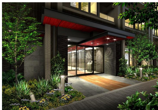
建物エントランス完成イメージ