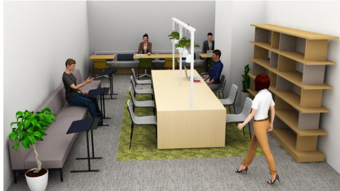
ワークラウンジイメージ

「仕事に集中したい」「気分を変えて自宅以外で勉強したい」といった多様な働き方・ライフスタイルに対応が出来る共用のワークラウンジを設けました。複合機・Wi-Fiを完備し、株式会社 KOKUYO による空間コーディネートにより機能的で利用しやすい空間となっています。