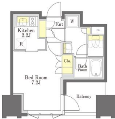
1K: 26.4 m 2 (D タイプ)

キッチン、バスルーム、トイレをそれぞれ独立させた機能的な単身者向けの間取りです。