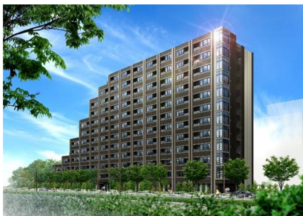
建物外観完成イメージ