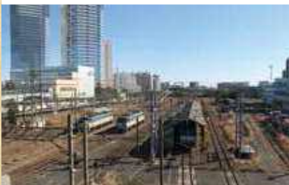
区内随一の鉄道ビュースポット