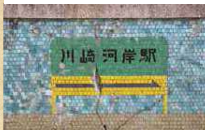
「川崎河岸線」という貨物線が走っていた鉄分スポット