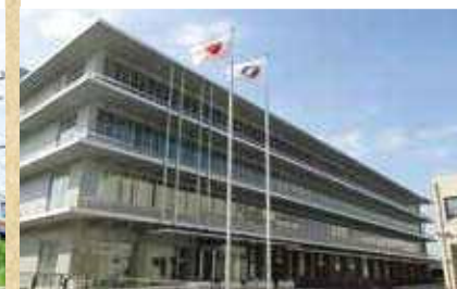
幸区の鉄道に関する特集展示を開催