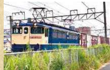
相鉄・JR 直通線や貨物列車が高速で通過するビュースポット