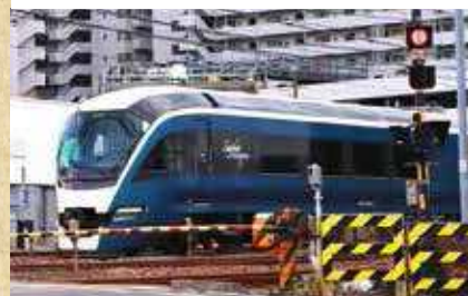
幸区で唯一、東海道線&京浜東北線を間近で感じられるビュースポット