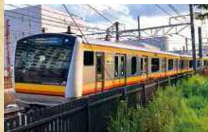
カーブを抜ける南武線を目の前で眺められるビュースポット