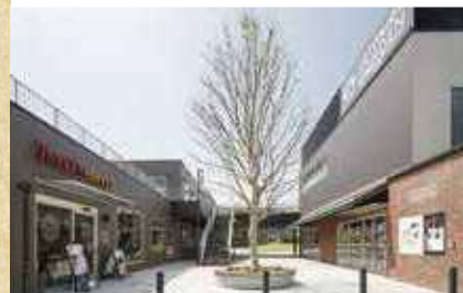
施設内に鉄道のレール等が使われている鉄分スポット