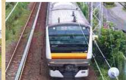
真上から南武線を見下ろせるビュースポット