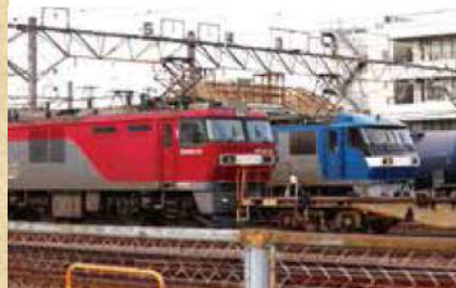
電車の遊具がある公園。遊具の後ろを本物の貨物列車が走り抜けます!