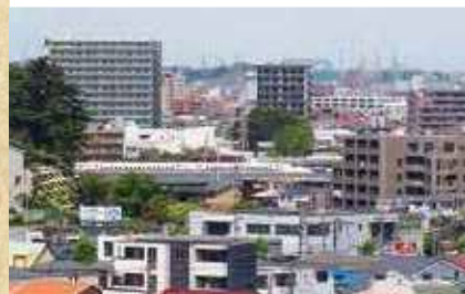
知る人ぞ知る、東海道新幹線のビュースポット