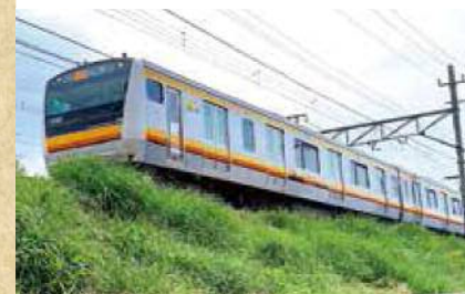
下からのアングルが映える南武線ビュースポット