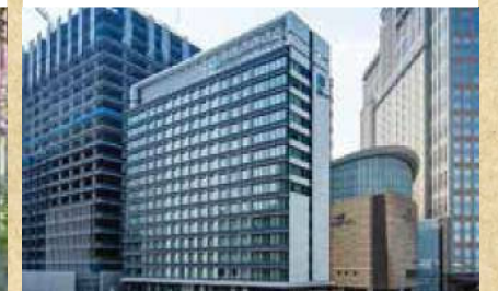
トレインビューの客室がある最新ホテル レストランには駅が見えるカウンター席もあり