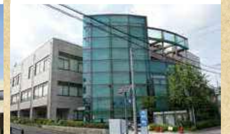
幸区の鉄道に関する特集展示を開催