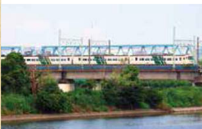
多摩川の陸橋を渡る鉄道のビュースポット