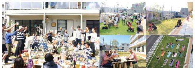
2018年 「アールリエット高円寺」 地域・コミュニティづくり 部門

※グッドデザイン賞とは1957年に通商産業省（現経済産業省）によって創立された「グッドデザイン商品選定制度」を承継して、1998年より財団法人日本産業デザイン振興会が主催する、わが国で唯一の総合的デザイン評価・推奨制度です。