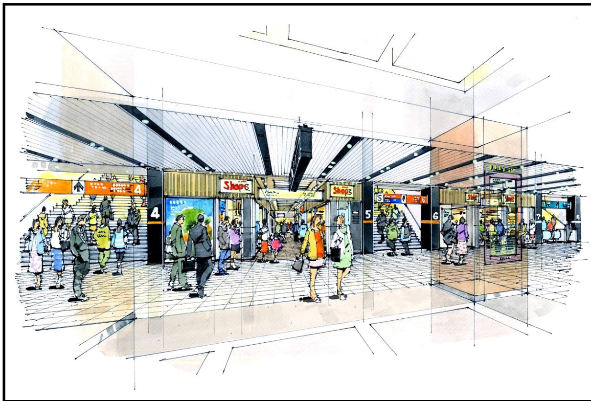
(ゾーン内イメージ)