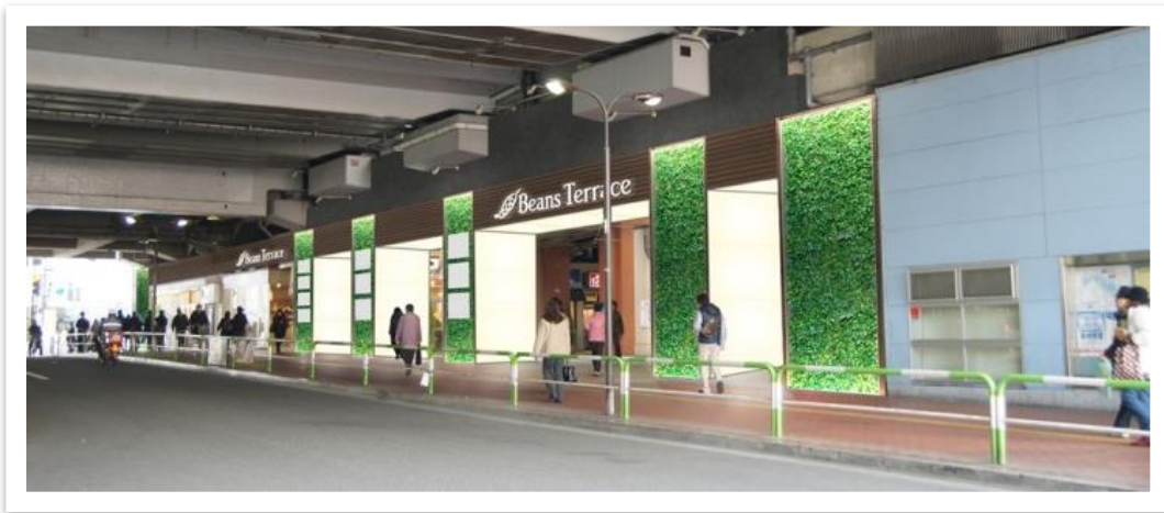
【ビーンズテラス エントランスイメージ】

株式会社ジェイアール東日本都市開発は、JR赤羽駅に直結するショッピングセンター「アルカード赤羽」の北ゾーンにある「生活提案館」を「まいにち、ゆったり自分時間」をコンセプトに、2014年11月13日（木）第一期リニューアルオープンいたします。これと同時に「アルカード」は「ビーンズ」に名称を変更します。「生活提案館」は手芸用品や書籍なども新たに加わり「ビーンズテラス」とゾーン名称を変更し、外空間としての心地よさも意識した店づくりを目指します。